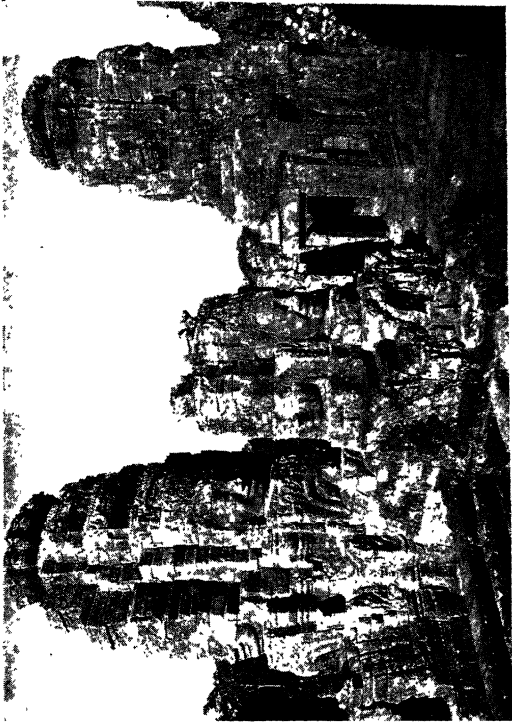
कम्बुज—बेयीन का मन्दिर